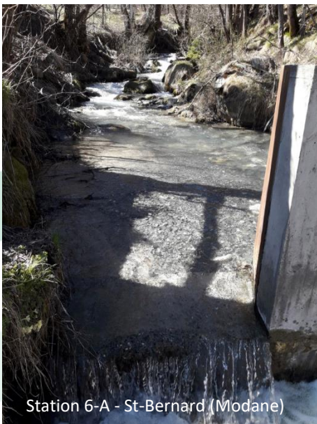
Station 6-A - St-Bernard (Modane)

Les précipitations de fin novembre/début décembre 2023 ont entraîné de nombreux désordres sur les stations du secteur de Saint-Michel : engravements significatifs de la Grollaz et du Vigny, arrachage de l'échelle de la Pérusaz. Les hautes eaux ont été atteintes mi-mai pour la Grollaz dont le débit baisse dès juillet pour atteindre les basses eaux en septembre. Sur le Vigny, les hauteurs d'eau restent élevées depuis 2024, influencées par l'engravement de la vasque de la station de mesure. Les hautes eaux sont toutefois visibles en mai-juin, le niveau baisse ce trimestre et retrouve les valeurs du printemps, encore élevées sur cette station. L'échelle de mesure a été réinstallée à la Pérusaz, la crue ayant modifié le lit, les nouvelles mesures ne sont pas corrélables à l'historique. Une nouvelle méthode de mesure est en test. Les hauteurs d'eau baissent, comme sur les autres ruisseaux depuis juillet.